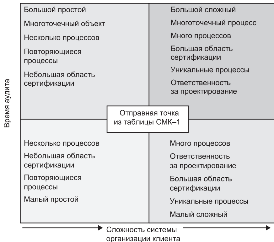
Рисунок SMK — 1 — Взаимосвязь сложности системы и времени аудита